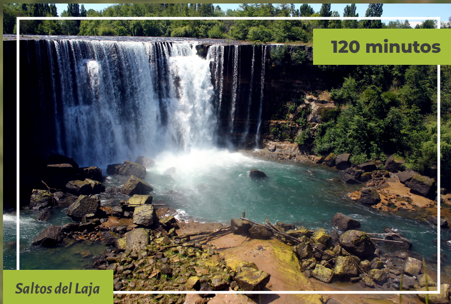
Saltos del Laja