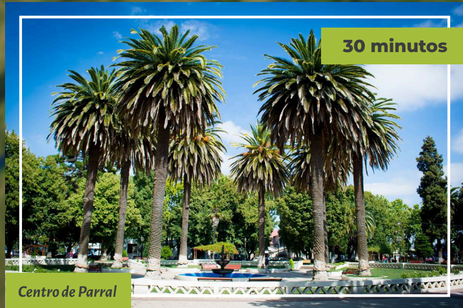
Centro de Parral