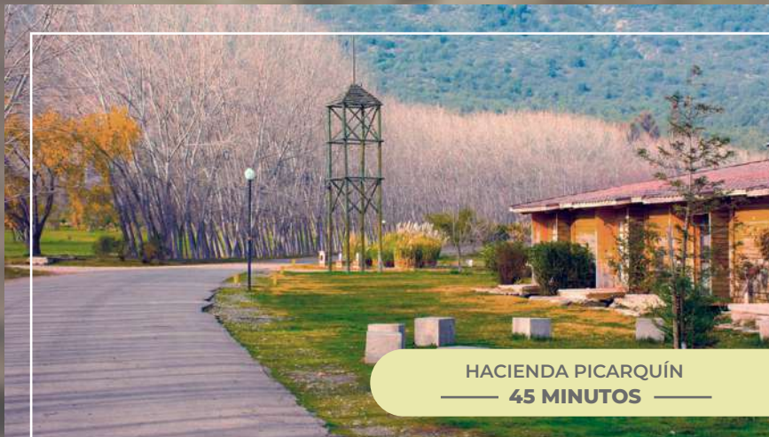
HACIENDA PICARQUÍN — 45 MINUTOS —