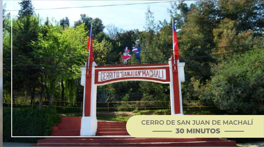
CERRO DE SAN JUAN DE MACHALÍ — 30 MINUTOS —