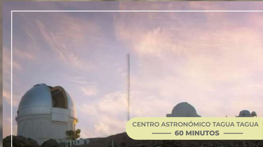
CENTRO ASTRONÓMICO TAGUA TAGUA — 60 MINUTOS —