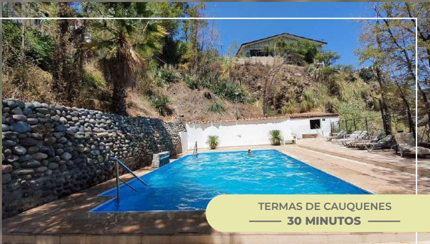
TERMAS DE CAUQUENES — 30 MINUTOS —