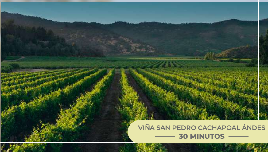
VIÑA SAN PEDRO CACHAPOAL ÁNDES — 30 MINUTOS —