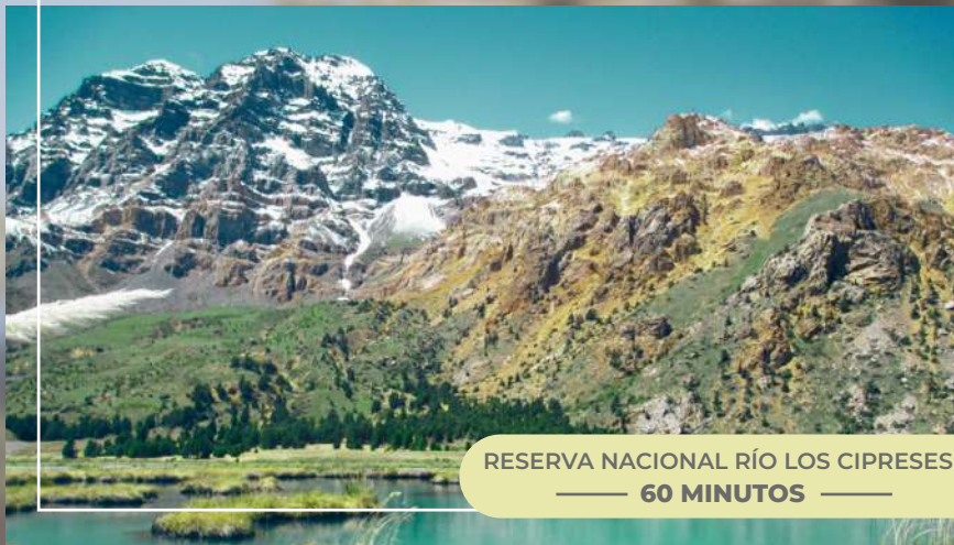
RESERVA NACIONAL RÍO LOS CIPRESES — 60 MINUTOS —