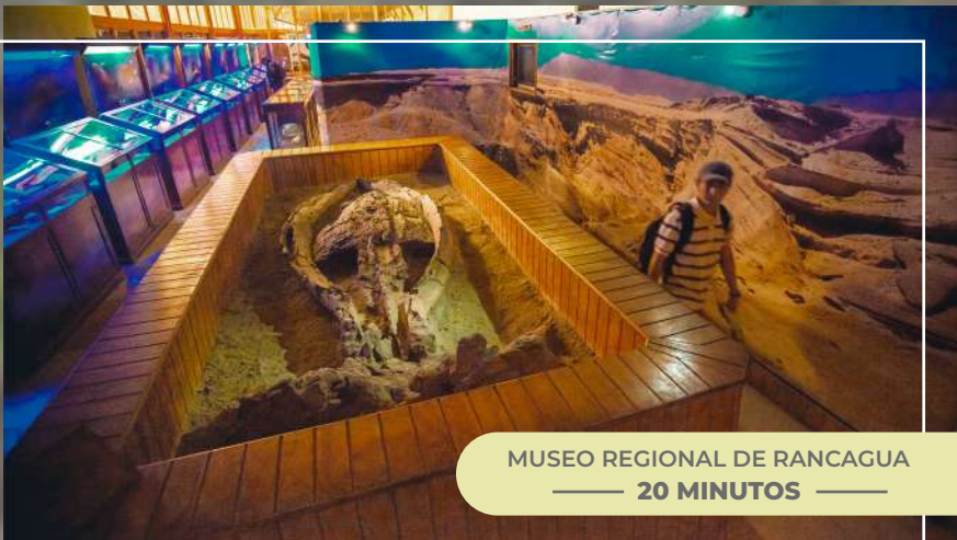
MUSEO REGIONAL DE RANCAGUA — 20 MINUTOS —